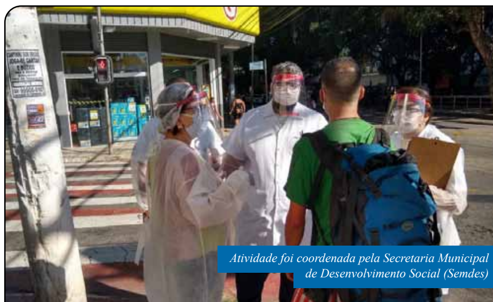
Atividade foi coordenada pela Secretaria Municipal de Desenvolvimento Social (Semdes)