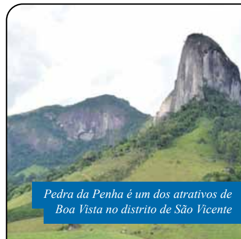
Pedra da Penha é um dos atrativos de Boa Vista no distrito de São Vicente

“Cachoeiro tem vocação para o turismo rural e nós estamos trabalhando, com várias ações, para favorecer o desenvolvimento desse setor, que oferece múltiplas possibilidades de geração de renda e criação de postos de trabalho no meio rural”, disse o prefeito.